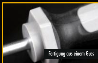
Fertigung aus einem Guss