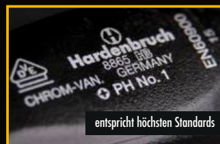
entspricht höchsten Standards