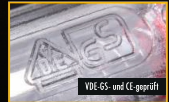
VDE-GS- und CE-geprüft