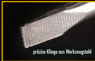
präzise Klinge aus Werkzeugstahl