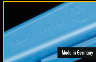
Made in Germany