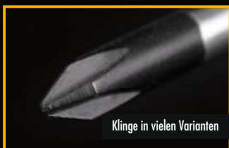
Klinge in vielen Varianten

⊕ lose, nach Absprache (Einzelverpackung möglich)