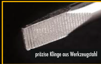
präzise Klinge aus Werkzeugstahl